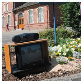
8ème Art : les Médias (Radio, Télévision, Photo) Rue de la Gare