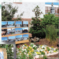
1er Art : l'Architecture Place du Marché