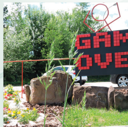
10ème Art : les Jeux vidéo et le Multimédia Rue des Ecoles