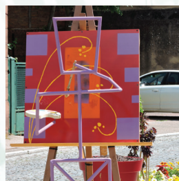
3ème Art : la Peinture & le Dessin Rue du Gal Goureau