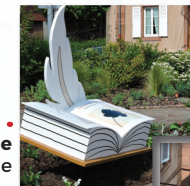
5ème Art : la Littérature et la Poésie Rue de l'Asile