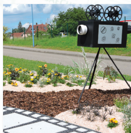
7ème Art : le Cinéma Rue Bellevue