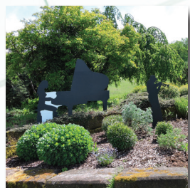
4ème Art : la Musique Rond point