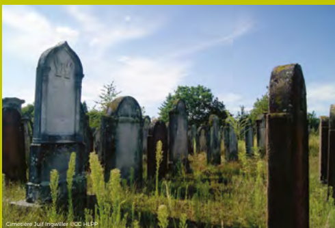
Cimetière Juif Ingwiller

Rendez-vous devant le cimetière, Faubourg du Général Philippot à INGWILLER