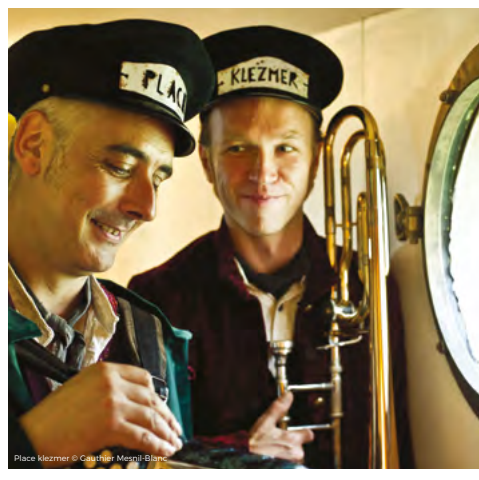
Place klezmer

Gratuit pour les -12 ans | Synagogue rue Principale, 67290 STRUTH