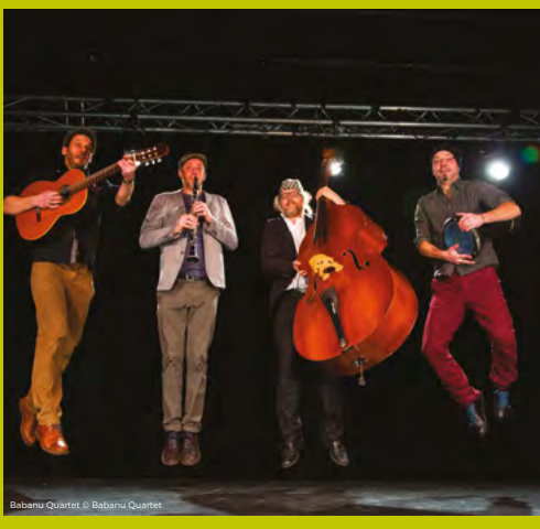
Babanu Quartet © Babanu Quartet