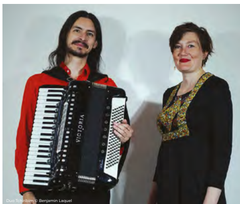
Duo Tchiribim

Gratuit pour les -12 ans | Synagogue 12 rue Principale, 67340 WEITERSWILLER