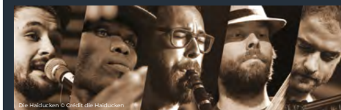
Die Haiducken

Buvette et petite restauration sur place à partir de 19h