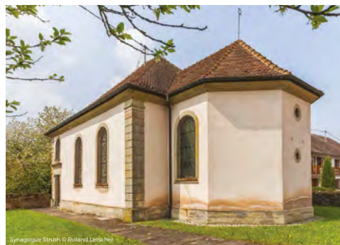
Synagogue Struth

Gratuit | Durée 1h | Rendez-vous à la synagogue rue Principale, 67290 STRUTH