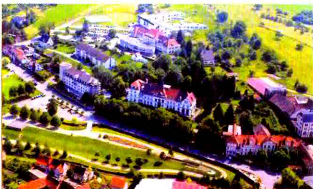
Groupe hospitalier du Neuenberg

Cependant, sous l'effet des mutations économiques de la seconde moitié du 20 ème siècle, l'industrie régressa.