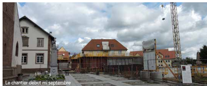
Le chantier début mi septembre

L'Institut National de Recherches Archéologiques Préventives (INRAP) ayant donné le feu vert pour la poursuite du chantier après les derniers relevés de géophysique et la procédure de veille archéologique, les travaux sont entrés dans une phase très dynamique. Le paysage urbain évolue chaque jour et les spectateurs ne manquent pas de constater l'avancée du chantier qui commence à prendre forme.