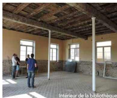
Intérieur de la bibliothèque

Dès cette fin d'année, on pourra aisément se projeter dans ce que sera cet ensemble Bibliothèque-Ecole de musique-Halle couverte et imaginer toutes les manifestations qui auront lieu dans cet espace où palpitera la vie du cœur de ville.