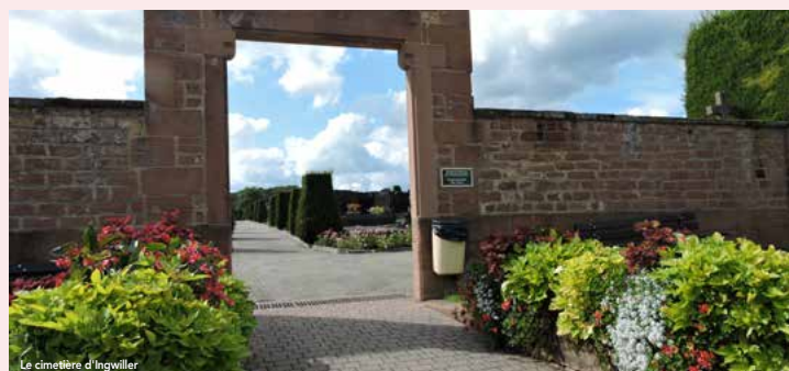
Le cimetière d'Ingwiller

Votre avis nous intéresse. Seriez-vous prêts à donner un peu de votre temps pour désherber le cimetière ? Merci de vos réponses sur communication.dni@gmail.com