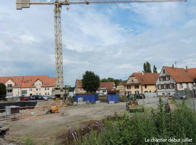
Le chantier début juillet