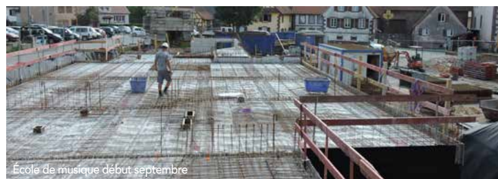
École de musique début septembre

Le sous-sol de la future école de musique est terminé. La grande salle de répétition, les salles de cours à l'étage ainsi que tous les étages, vont être réalisés durant ce dernier trimestre. L'ancienne bibliothèque a été débarrassée de ses anciennes cloisons et de l'escalier en bois avant sa reconstruction interne. Elle sera reliée à l'école de musique par le sas d'entrée, surplombé d'une verrière, qui accueillera un ascenseur et une mezzanine. Le remblaiement partiel du côté de la rue de la Grange aux Dîmes a été réalisé au courant du mois d'août. L'objectif est que le nouveau bâtiment Bibliothèque-Ecole de musique soit clos et couvert avant la fin de cette année.