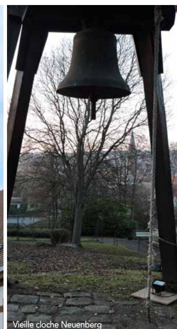
Vieille cloche Neuenberg