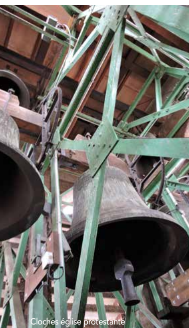
Cloches église protestante

La cloche Saint Martin située dans le clocheton sur l'ancienne Maison des Sœurs résonne tous les dimanches pour annoncer le culte mais également les offices des Sœurs. Vous n'entendrez celle du parc du Neuenberg qu'en de très rares occasions.