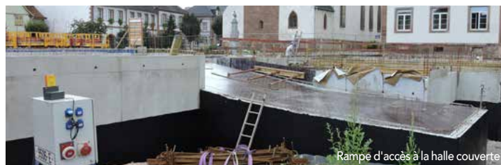
Rampe d'accès à la halle couverte

En parallèle, les travaux de la halle couverte ont bien avancé avec la réalisation des fondations du parking bas et la pose du plancher haut qui accueillera le marché et les diverses manifestations. Les gradins en prolongement du parvis vers la halle ainsi que les escaliers descendant au parking couvert, seront mis en place. Des sanitaires publics seront réalisés le long de la rampe d'accès qui était déjà visible à la fin de l'été.