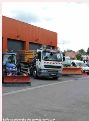
La flotte des engins des services municipaux