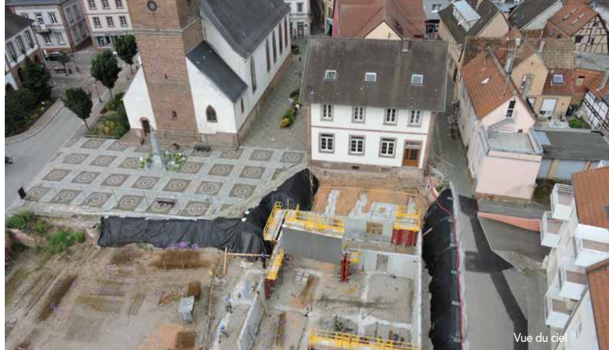
Vue du ciel