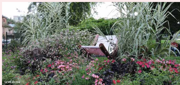
La vie en rose

L'été n'est plus qu'un lointain souvenir et l'équipe Espaces Verts nous a ravi avec de beaux pare-terre de fleurs et autres compositions florales. La commune étant engagée dans un objectif « Zéro produit phytosanitaire » (nos 2 libellules), l'équipe était fort mobilisée par le désherbage. Seul le cimetière, prochainement doté d'un portail, était encore traité mais dès 2018, son désherbage sera également manuel, ce qui ne sera pas une mince affaire. Certains concitoyens ont suggéré de faire de l'entretien du cimetière un chantier citoyen.