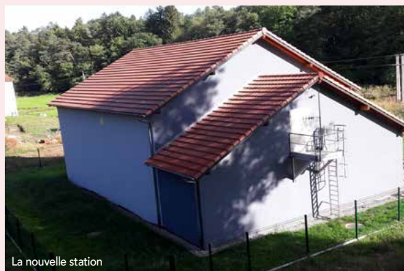
La nouvelle station

Les essais pour s'assurer du bon fonctionnement ont été réalisés avec succès et la mise en service de la nouvelle station aura lieu très prochainement. La phase suivante sera la démolition de l'ancienne station après 90 ans de bons et loyaux services.