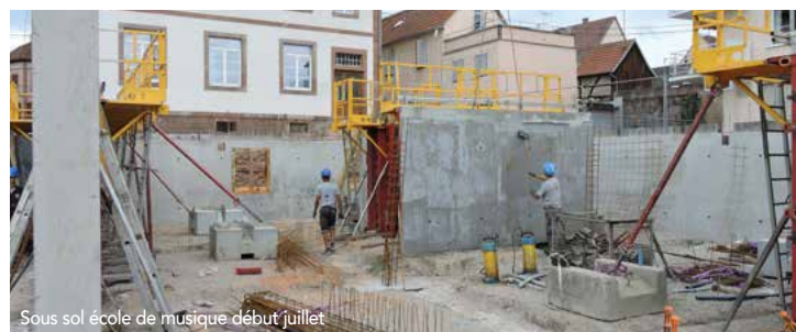
Sous sol école de musique début juillet

Le sous-sol de la future école de musique est terminé. La grande salle de répétition, les salles de cours à l'étage ainsi que tous les étages, vont être réalisés durant ce dernier trimestre. L'ancienne bibliothèque a été débarrassée de ses anciennes cloisons et de l'escalier en bois avant sa reconstruction interne. Elle sera reliée à l'école de musique par le sas d'entrée, surplombé d'une verrière, qui accueillera un ascenseur et une mezzanine. Le remblaiement partiel du côté de la rue de la Grange aux Dîmes a été réalisé au courant du mois d'août. L'objectif est que le nouveau bâtiment Bibliothèque-Ecole de musique soit clos et couvert avant la fin de cette année.