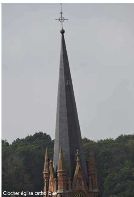
Clochier église catholique