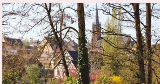
Lauréats 2017 cf dni n°15

Le concours photo a été reconduit pour 2017/2018. Les inscriptions sont d'ores et déjà ouvertes et seront clôturées le lundi 16 avril 2018. Vous trouverez le règlement en mairie ou sur le site www.mairie-ingwiller.eu