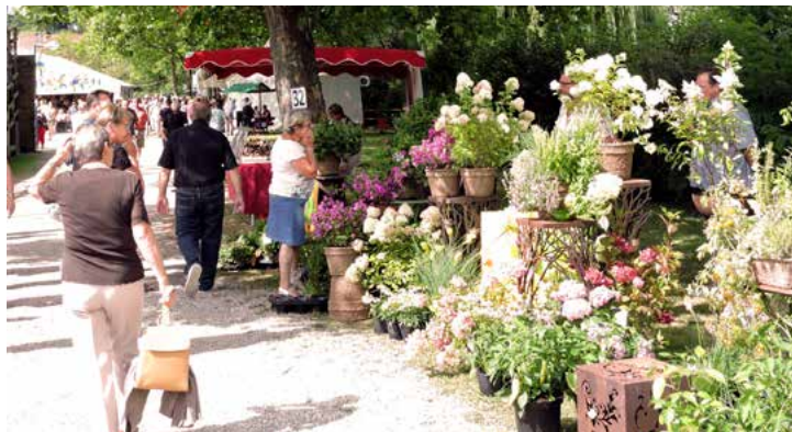
Les jeudis de la danse avec « Dans'Ing ». Ici, l'Association folklorique du Herrenstein accompagnant le Groupe folklorique de Jetterswiller.