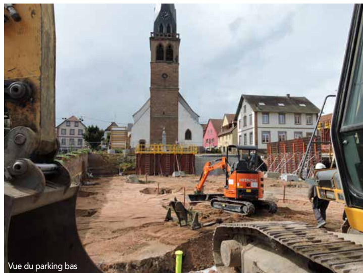
Vue du parking bas