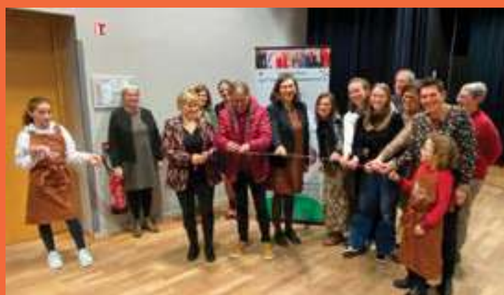
INAUGURATION DE L'EPICERIE SOLIDAIRE