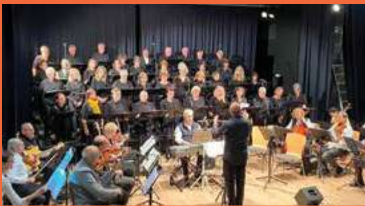
CONCERT DE L'ENSEMBLE DE CORDES