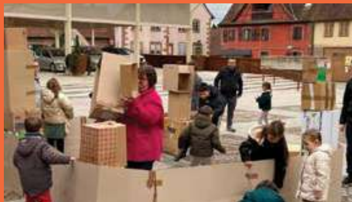
NUIT DE LA LECTURE