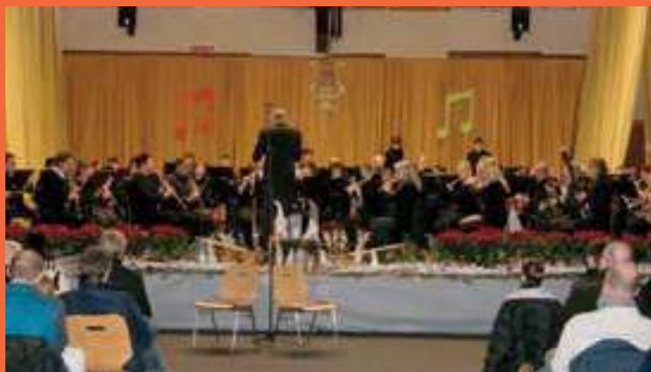
CONCERT DE NOUVEL AN DE LA MUSIQUE MUNICIPALE