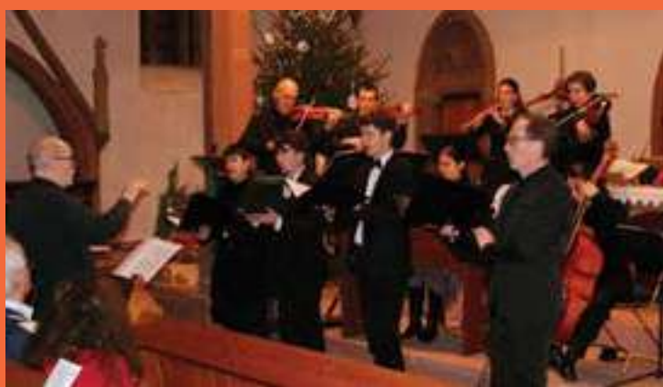
CONCERT HORTUS MUSICALIS